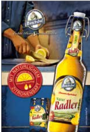
Format: 1185 x 1750 mm

CityLight-Poster sind sehr auffällige Werbeträger in Einkaufszentren, Fußgängerzonen und an Haltestellen. Ihre Beliebtheit in der Branche spiegelt sich in der wachsenden Stellenanzahl wider. Ihr ansprechendes Design, die Präsentation hinter Glas sowie die Hinterleuchtung punkten beim Betrachter. //